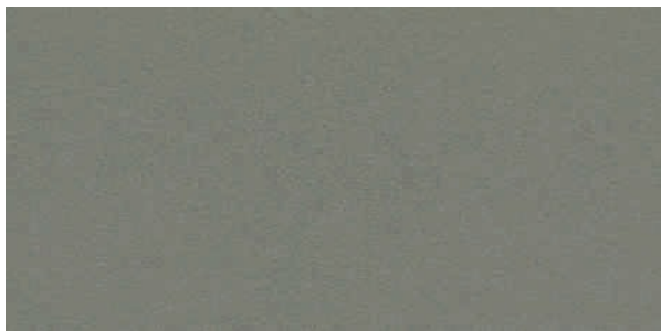
L06 dark grey