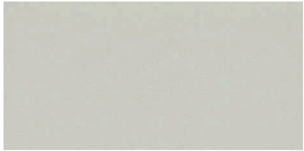
L07 light grey