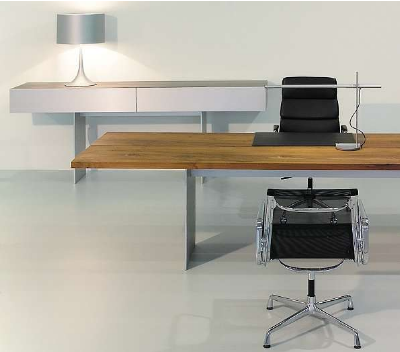
Bild: Rechtecktisch mit Wangenuntergestell in Nussbaum massiv, Korpus in Lack, dahinter Console in Nussbaum massiv, mit Fronten und Wangen in Aluminium gebürstet und natur eloxiert.

TIX-Office standalone rectangular table. The clear cubic body creates storage space and provides access to the necessary equipment infrastructure directly on the desk.