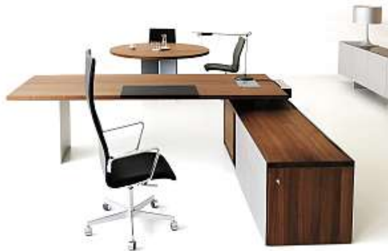
TIX-Office, Rechteckisch in Kombination mit TIX-Lowboard, ganze Kombination in Schwarznussbaum massiv. Ergänzt mit lateraler Steckerbox. Dahinter freistehender, runder Besprechungstisch mit TIX-Bogenwangen. Rechts TIX-Sideboard in Lack. TIX-Office, rectangular table with TIX-Lowboard, both in solid black walnut with electrical equipment box. Behind standalone, round consultation table with TIX-curved blade. On the right side TIX-Sideboard painted in color.