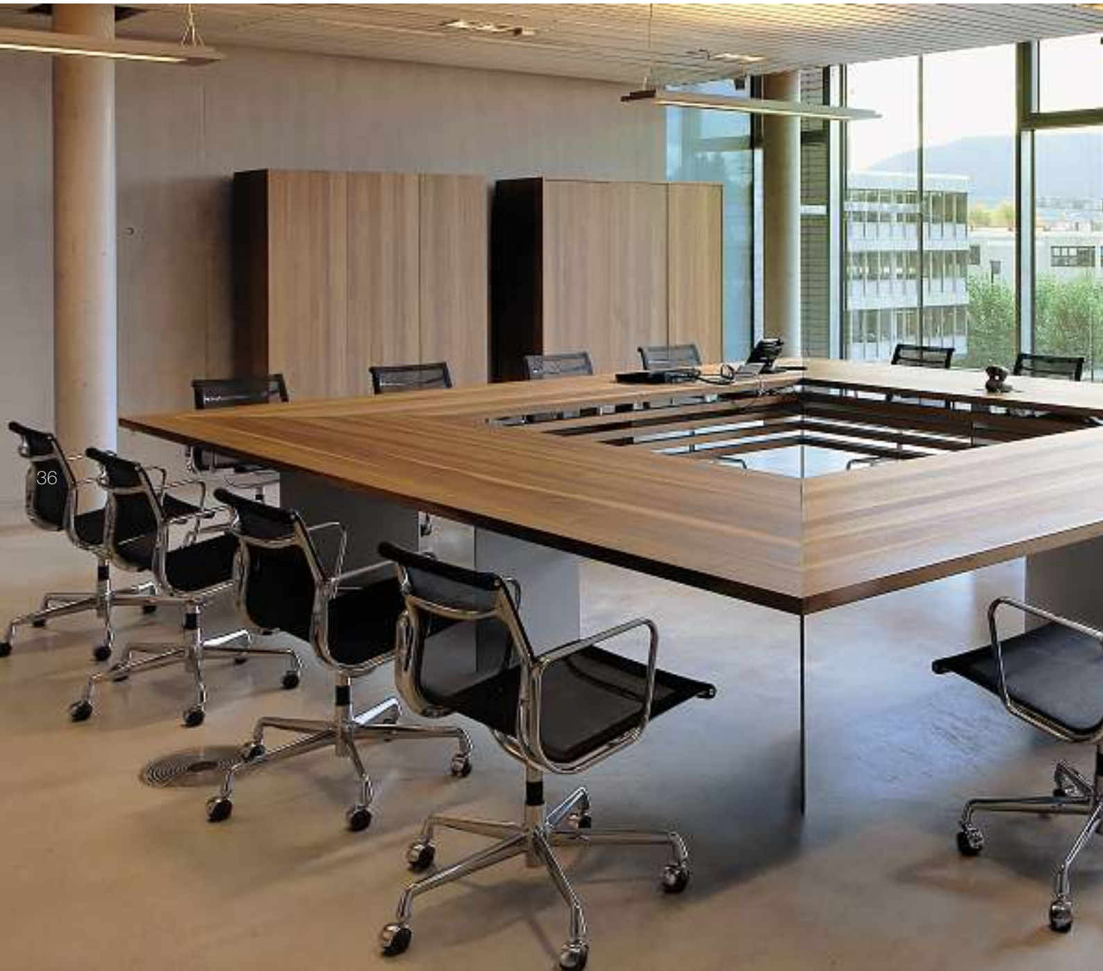
Bild: Quadratische Tischanlage für 20 bis 24 Teilnehmer. Tischplatte und Sichtblende in Schwarznussbaum massiv, Untergestell in Aluminium gebürstet natur eloxiert.

Grosse Konferenzanlagen auf der Konzernleitungsebene stellen neben den hohen formalen Anforderungen auch höchste Ansprüche an die Integration der Kommunikationstechnik. Diese digital vernetzte Medientechnologie prägt das Sitzungsprotokoll wie auch das Möbel gleichermassen. Zoom by Mobimex steht Ihnen dabei mit der grossen Planungserfahrung und dem Know-how als kompetenter Partner und Berater zur Seite. Wir verbinden starkes Design und modernste Technologie, damit Sie auch in Zukunft Ihre volle Aufmerksamkeit ihren Geschäftspartnern widmen können.