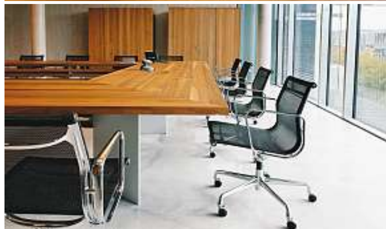
Bild nächste Seite: Hufeisenförmige Konferenztischanlage in Wengé massiv. Unter dem flächenbündig im Tisch eingelassen Band in Aluminium verbergen sich die Medienschnittstellen und hochfahrbare Monitore für die Konferenzteilnehmer. Untergestell und Sichtblende im Knieraum in Aluminium natur eloxiert.

Picture next page: Horse-shoe conference table in solid wenge wood. The media interfaces and monitors for conference participants, which can be raised into position for use, are concealed beneath the aluminium strip built in flush with the table surface. Underframe and kneespace surround are in anodized aluminium.