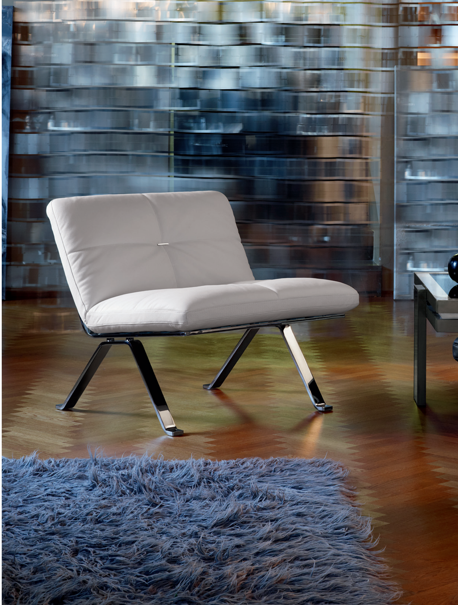
▲ Brooklyn armchairs Pelle Frau ® SC 0 Polare, Pelle Frau ® SC 20 Inchiostro.